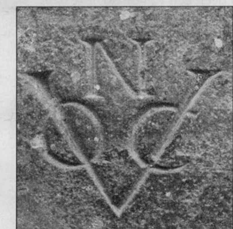
Logo van de VOC