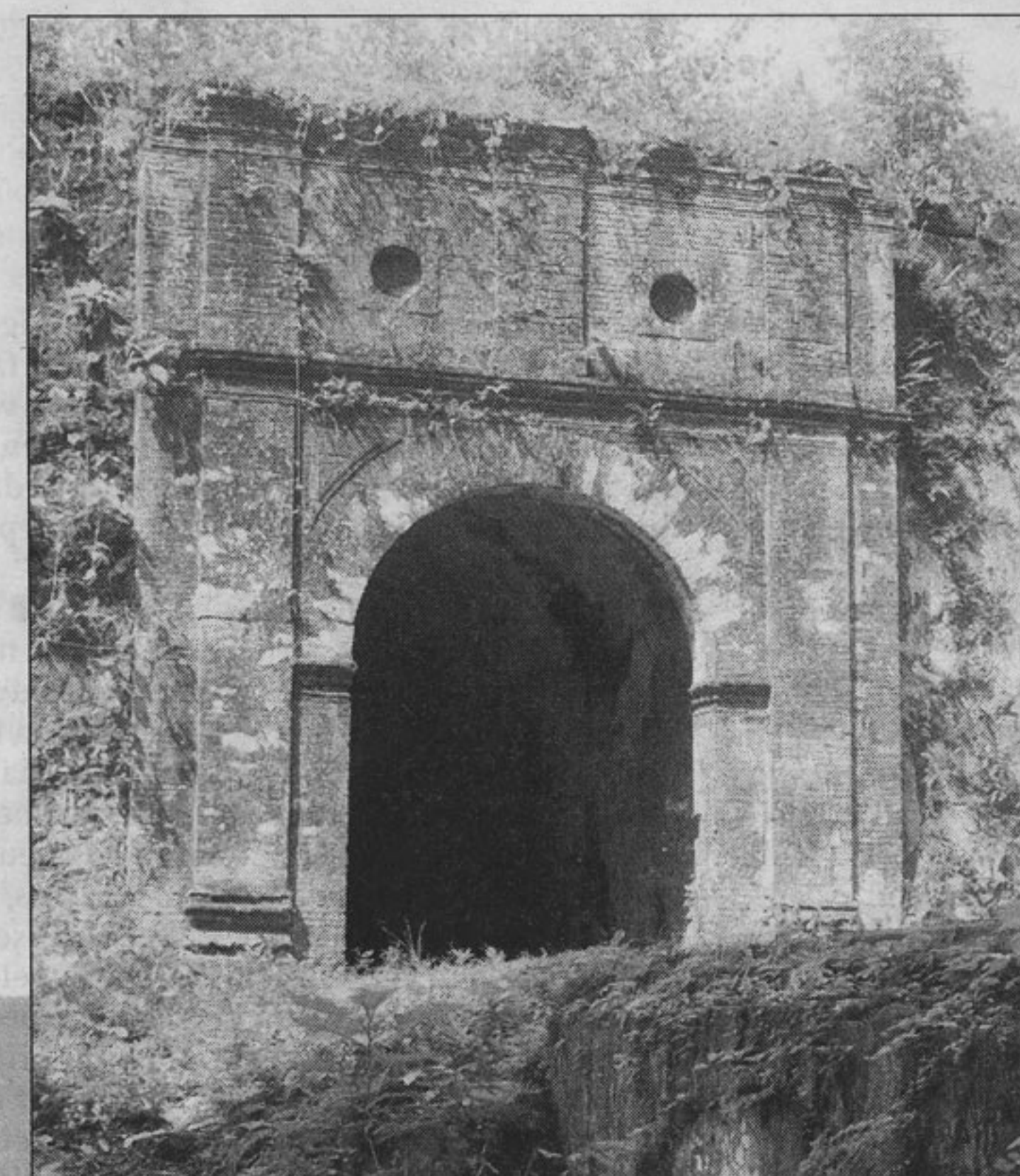
Toegangspoort fort Nassau op Banda Neira