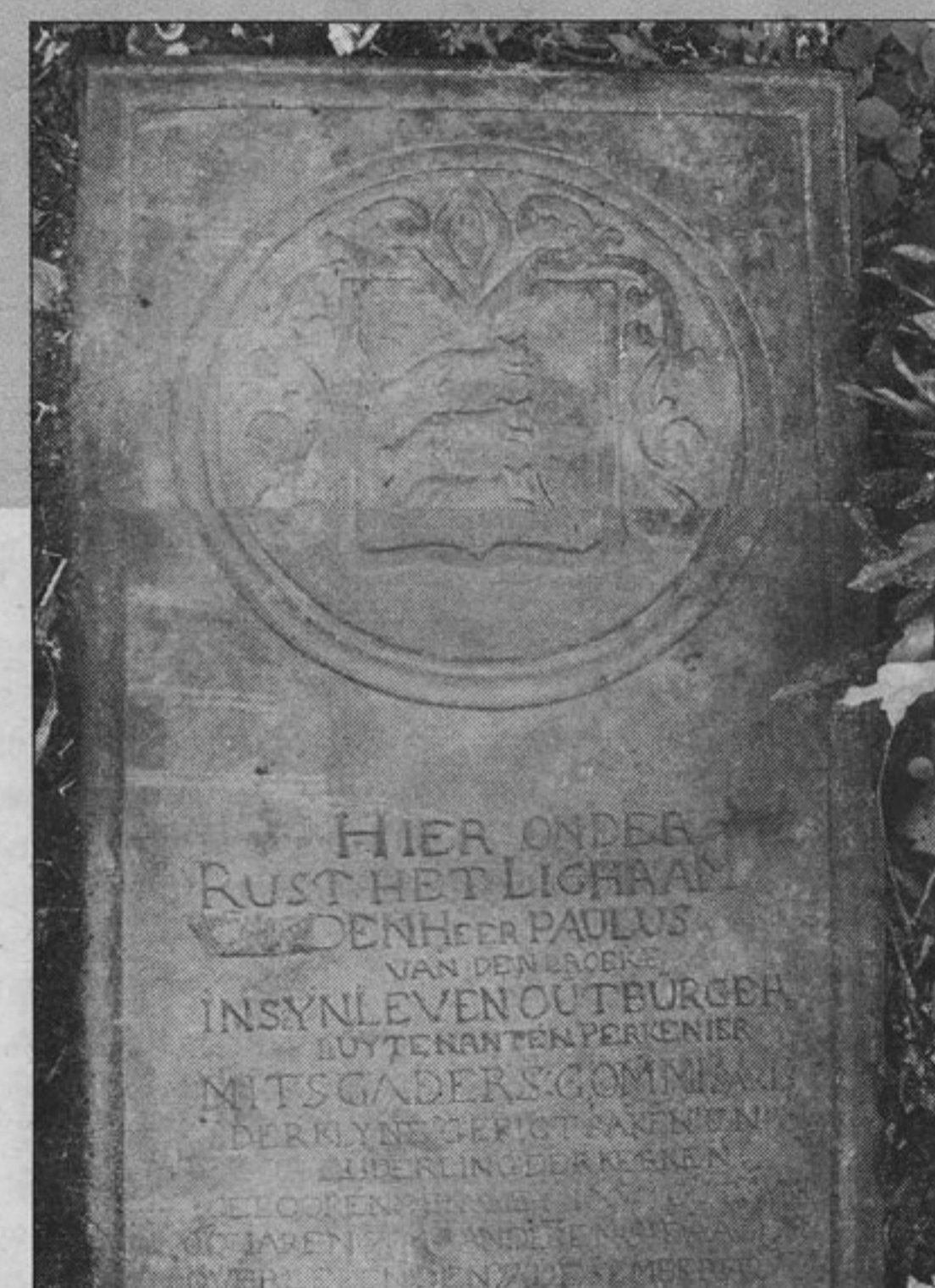
Grafsteen van Paulus van den Broecke