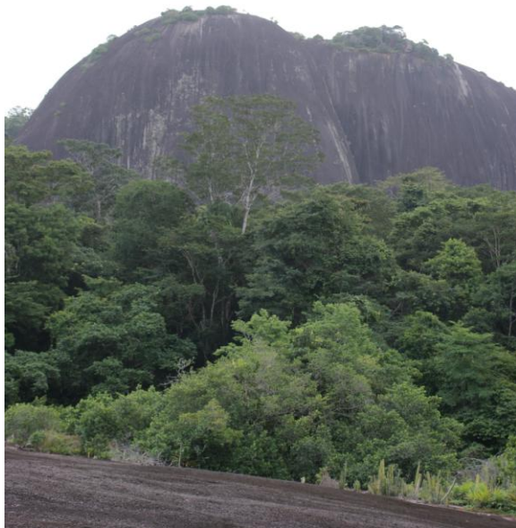
Voltzberg in Suriname. Foto: Caroline van der Mandele, 2009

In het Nationaal Archief te Den Haag bevinden zich twee afschriften van zowel het eerste als tweede reisverslag van Fredrik Hoeus uit 1717. Eén exemplaar bevindt zich in het archief Verspreide West-Indische Stukken en de ander in de Overgekomen Brieven en Papieren aan de Sociëteit van Suriname. Beide zijn kopieën en beslaan veertien (folio) bladzijden in een goed leesbaar handschrift. Het journaal van de eerste reis is op 20 juni 1717 te Paramaribo opgemaakt. Hoeus was daar zelf niet bij aanwezig, want een week daarvoor was hij alweer vertrokken voor zijn tweede Coppename-expeditie. 6